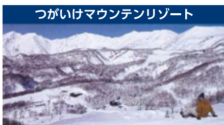
つがいけマウンテンリゾート