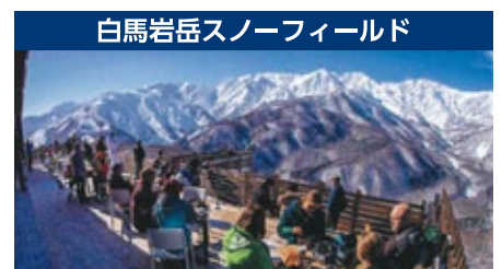
白馬岩岳スノーフィールド