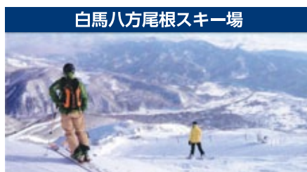
白馬八方尾根スキー場