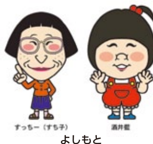
すっちゃん(すち子)

(つがいけマウンテンリゾート・白馬八方尾根スキー場・白馬岩岳スノーフィールド・鹿島槍スキー場・竜王スキーパーク・菅平高原スノーリゾート・めいほうスキー場・みやぎ蔵王えびしリゾート・川場スキー場・オグナぼたかスキー場)