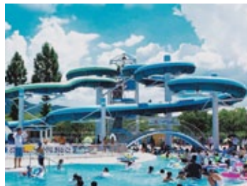
亀岡運動公園プール